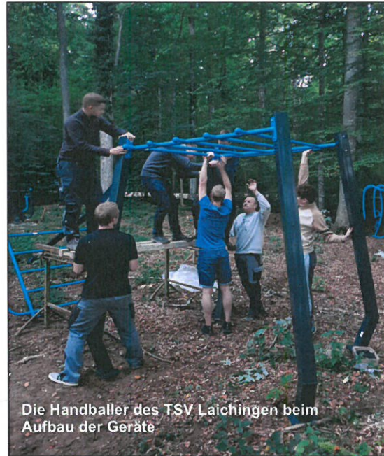
Die Handballer des TSV Laichingen beim Aufbau der Geräte

Die gesetzlich verordneten Einschränkungen aufgrund der Corona-Pandemie haben vor allem auch den Breitensport schwer getroffen. Im Besonderen gelitten haben Kinder und Jugendliche, die komplett auf Vereins- und Schulsport verzichten mussten. Viele Kinder und Jugendliche haben wegen fehlender körperlicher Betätigung und mangelnder Sozialkontakte seelische Probleme und sind in psychologischer Behandlung. Aktionen, welche der Partnerschaftsfonds „Sportstiftung“ üblicherweise unterstützt, konnten in der letzten Zeit nicht stattfinden – deshalb werden wir unsere Bemühungen, Kinder und Jugendliche für den Sport zu begeistern, nun verstärken. Sommerferienprogramme, Sportfreizeiten und Trainingslager fördern nicht nur das sportliche Können sondern vermitteln auch Kompetenzen im sozialen Umgang und im persönlichen Krisenmanagement. Gewinnen und Verlieren, Training von Ausdauer und Zuversicht – dadurch wird die mentale Kraft gestärkt!